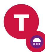
Taalcursussen beginners 3