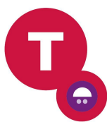
Taalcursussen beginners 2