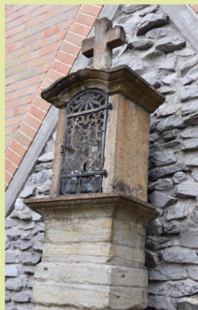
hoevetje dat het jaartal 1859 vermeldt.

Herberg "In de Zwarte Flesch" werd afgebroken en maakte in 1990 plaats voor een vestiging van vzw Schoonderhage. Deze vereniging staat in voor de opvang van volwassenen met een mentale beperking. Nu is er van de vroegere herberg geen spoor meer te bekennen of toch? Men kan er inderdaad -zij het in een volledige nieuwbouw- op zonen feestdagen terecht in het café of, bij mooi weer, met veel geluk op het drukbezochte terras. Zeg niet zomaar "een terrasje doen" tegen deze hemelse plek aan de Dender... De Zwarte Flesch is een merkteken op de tocht van wandelaars en fietsers, een karakteristiek symbool van de vernieuwde Dendervallei en de rivier waarvan het prachtigste stuk zich stroomopwaarts voorbij Ninove bevindt. (bronnen: Erfgoedcel Denderland en M&L, Dirk Van de Perre).