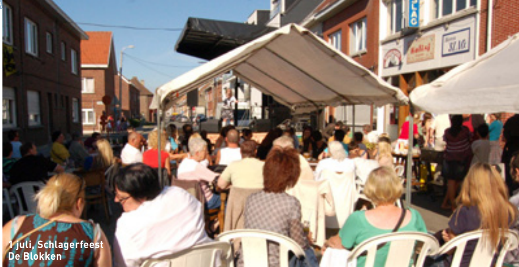
1 juli, Schlagerfeest De Blokken

Inschrijven en info: jeugddienst Ninove, jeugdcentrum De Kuip, Parklaan 1, Ninove, 054 31 05 00, jeugd@ninove.be