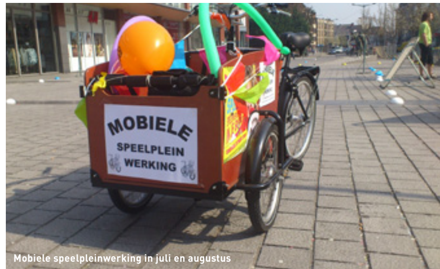
Mobiele speelpleinwerking in juli en augustus