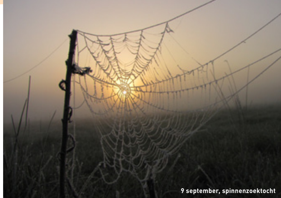
9 september, spinnenzoektocht

wouter.mertens@natuurpuntninove.be , www.natuurpunt.be/ninove , 0495 68 89 33