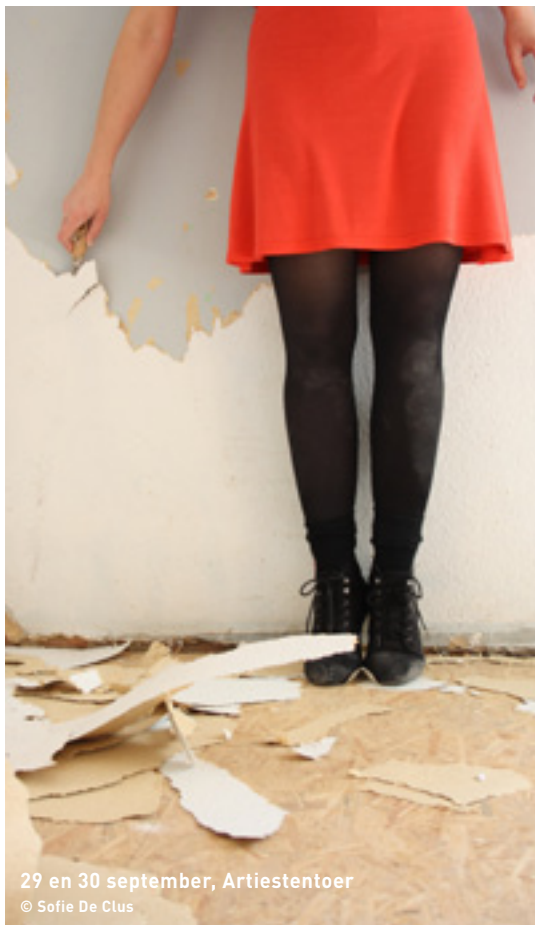
29 en 30 september, Artiestentoer

Wat? Ninove heeft twee gerestaureerde windmolens: de Wildermolen in Appelterre, een houten staakmolen, en de Molen ter Zeven Wegen in Denderwindeke, een stenen korenwindmolen. Onder leiding van een gids wandel je van de ene molen naar de andere en terug.