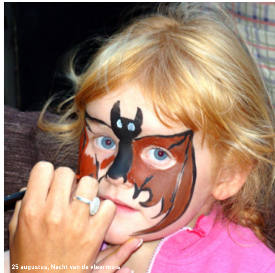
25 augustus, Nacht van de vleermuis

Wanneer? Dinsdag 28 augustus. Volksspelen vanaf 13 uur. Optredens vanaf 17 uur.