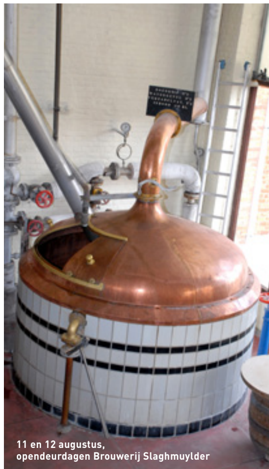
11 en 12 augustus, opendeurdagen Brouwerij Slaghmuylder

Wat? Middagpauze op school: de toiletten worden even de navel van de wereld. "Bezet!" swingt de pot uit. Een voorstelling over pestkoppen met gevoelige kantjes, de vreemde hobby's van de klusjesman en het gevaar van de gsm. Met mooie jongleerpatronen, straffe acrobatie, verrassende wendingen, veel visuele grappjes, een saxofoon en één eenwielerlooping. Philladoesh is een productiegroep van zeven jongeren tussen 15 en 18 jaar, die circus maken in het Mechelse circusatelier Circolito. www.circolito.be