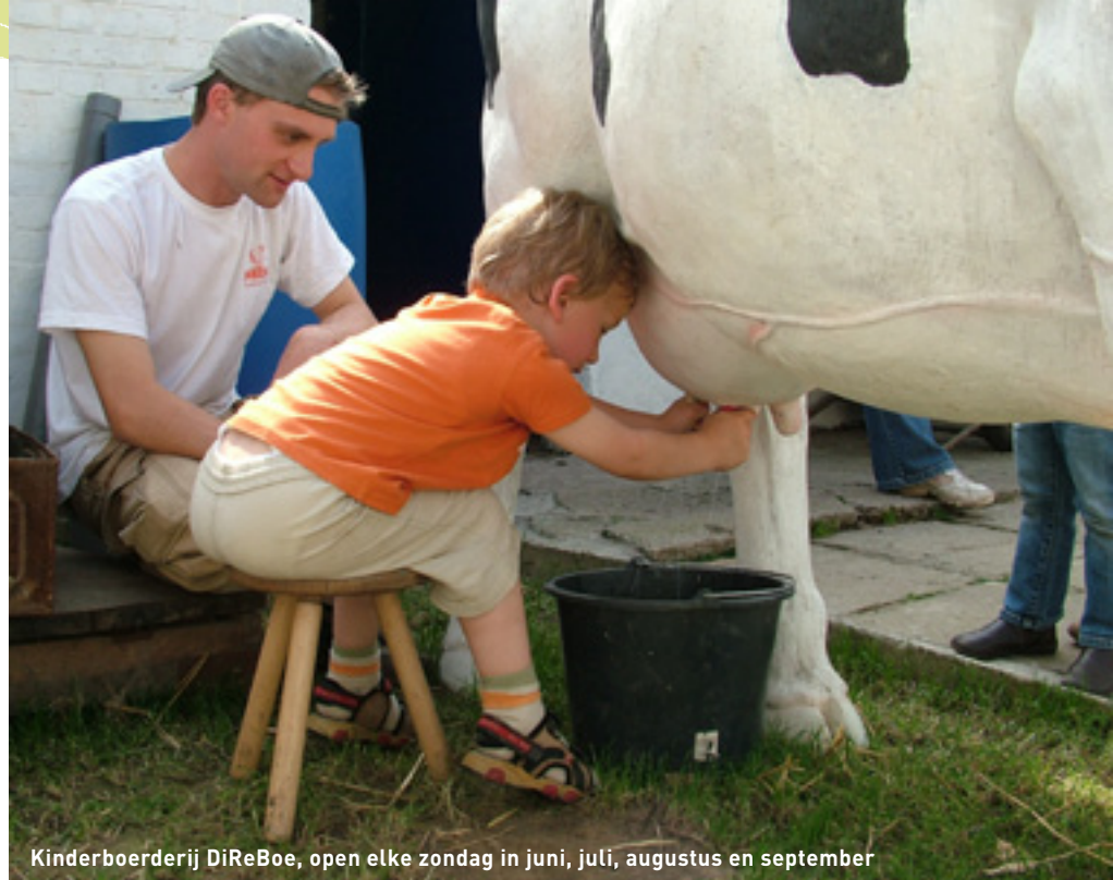
Kinderboerderij DiReBoe, open elke zondag in juni, juli, augustus en september

Wanneer? Zaterdag 2 juni van 17.30 uur tot 21.30 uur