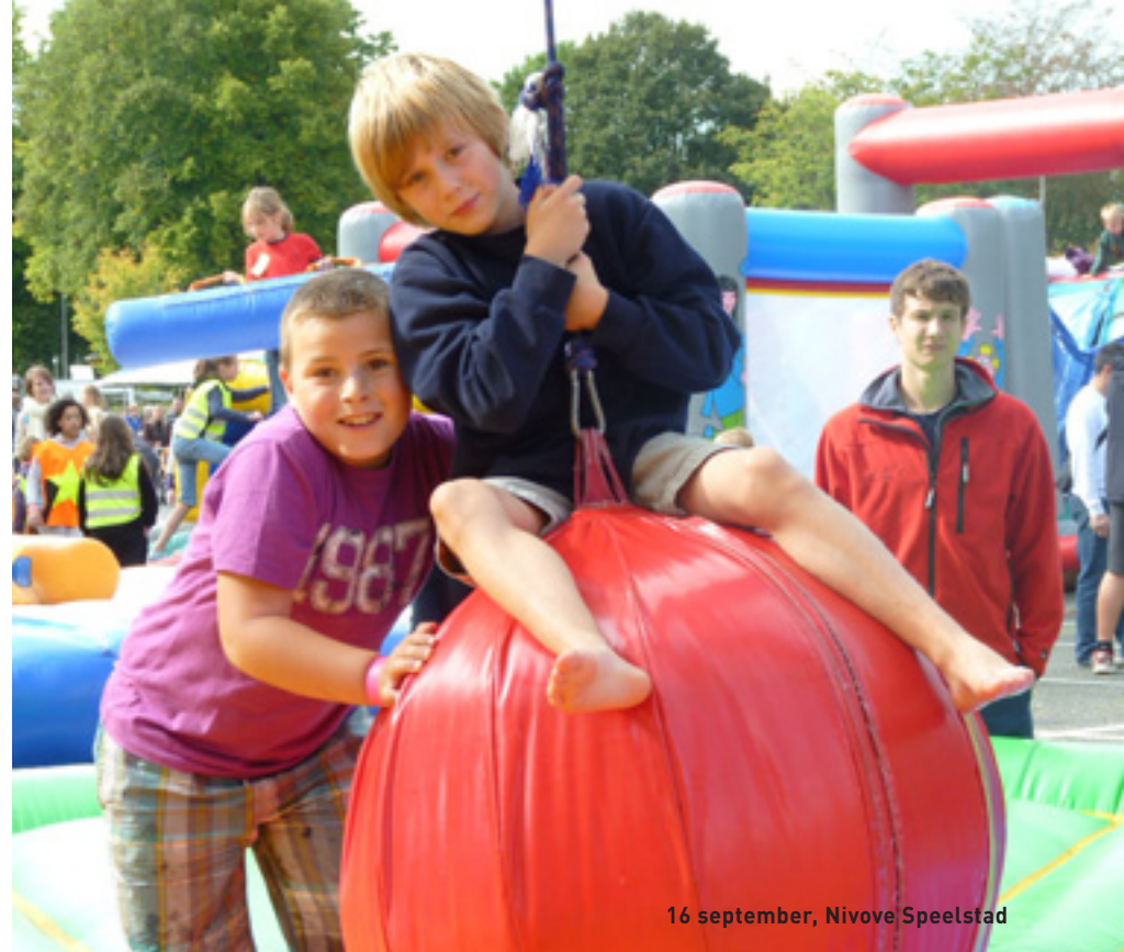
16 september, Ninove Speelstad

Wat? Autovrije zondag in het centrum van Ninove. Activiteiten: fietstocht "Over de heuvels van...", gratis fietsgraving, wandeltochten, Ninove Speelstad!... De vzw Ninoofse Feesten voorziet een brunch met aperitiefconcert. Hou de Ninove Info van september en de website van de stad in de gaten voor meer details!