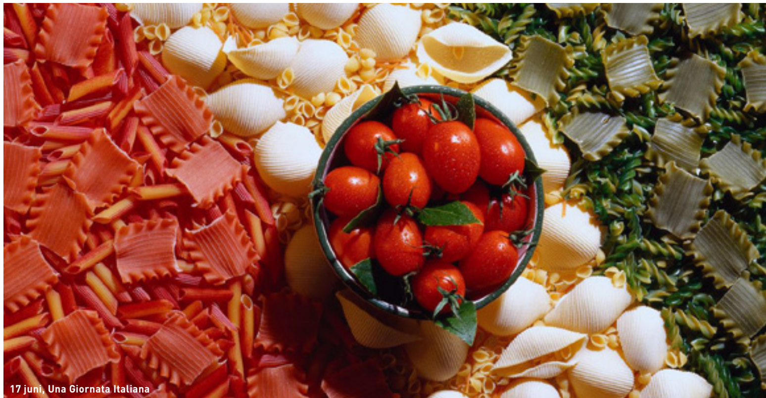
17 juni, Una Giornata Italiana