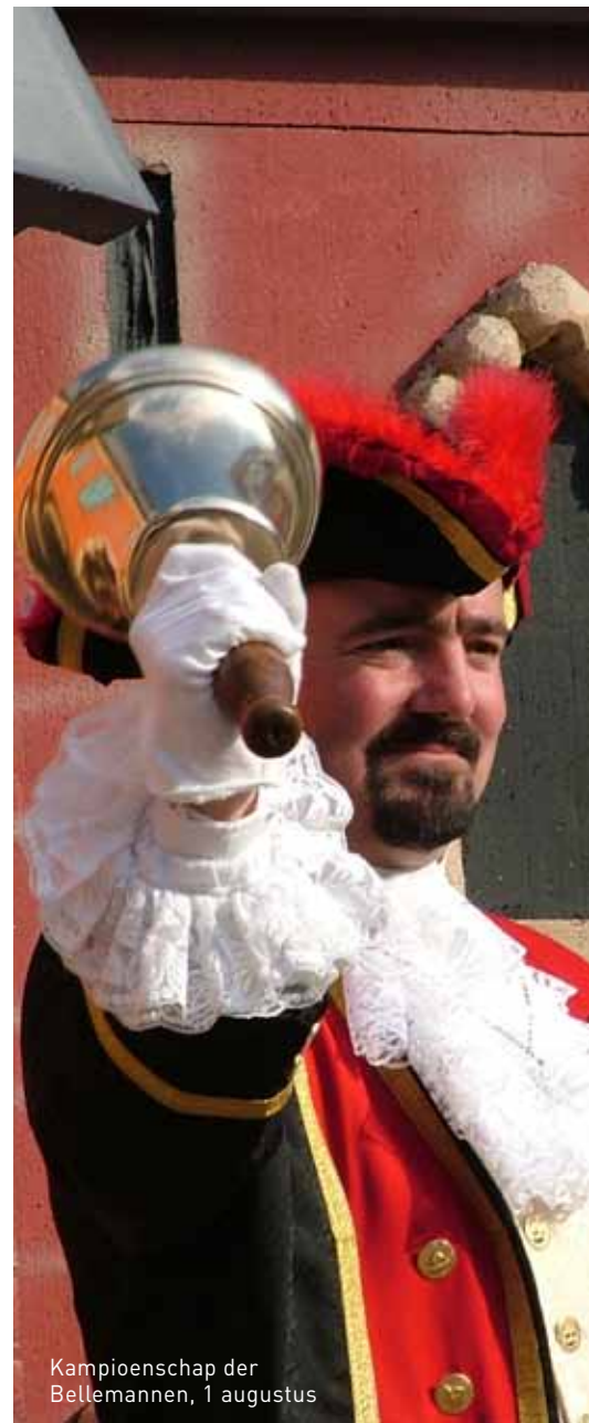
Kampioenschap der Bellemannen, 1 augustus

Wie? vzw Vita Waar? Atletiekpiste, Atletiekweg, Ninove Wanneer? Zaterdag 7 augustus om 15 uur