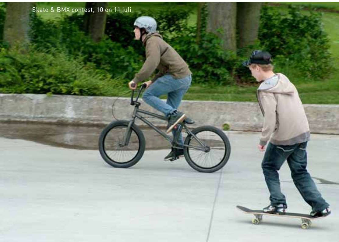
Skate & BMX contest, 10 en 11 juli

Info: dienst cultuur, Centrumlaan 100, Ninove • 054 31 32 87 • cultuur@ninove.be