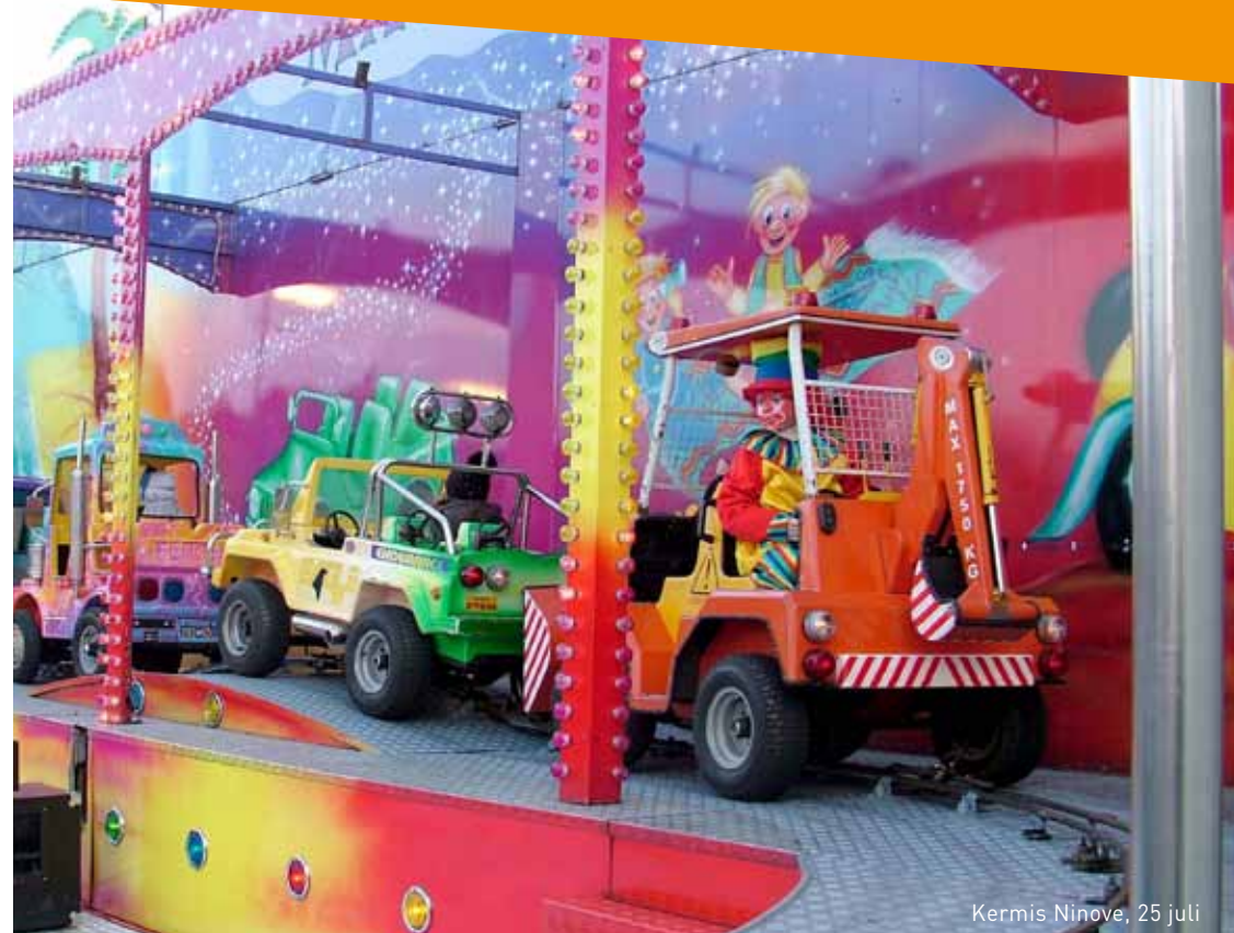
Kermis Ninove, 25 juli

Info: dienst cultuur, Centrumlaan 100, Ninove • 054 31 32 87 • cultuur@ninove.be