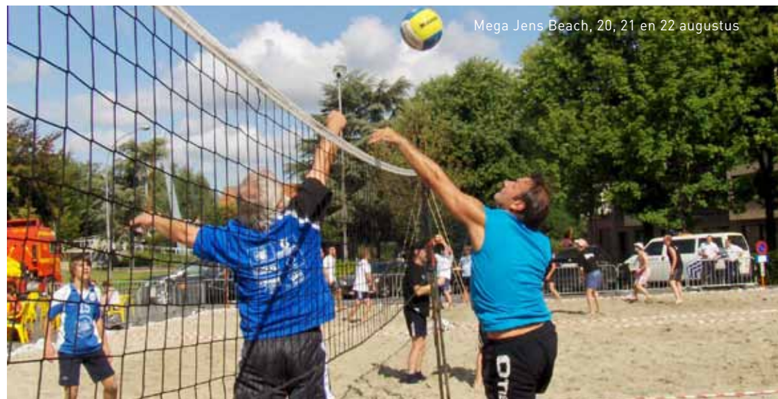
Mega Jens Beach, 20, 21 en 22 augustus

Wat? Dendertocht uitgewerkt als trein-boot-combinatie vanuit Ninove. Vertrek om 10.50 uur