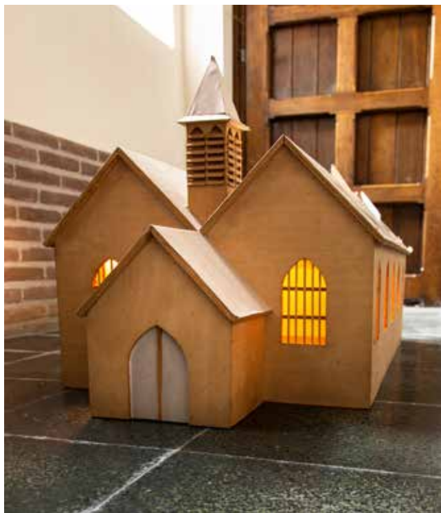
Een maquette van de houten kerk, te bezichtigen in de kerk van Lebeke.