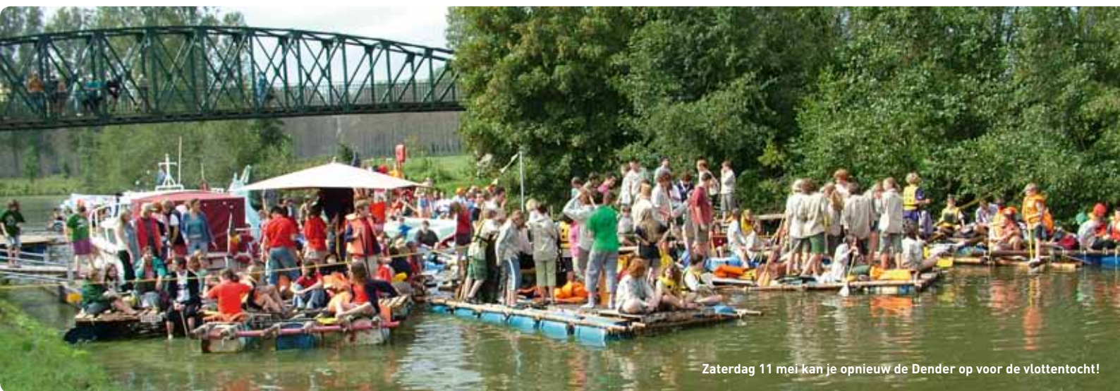
Zaterdag 11 mei kan je opnieuw de Dender op voor de vlottentocht!

Alle verenigingen (jeugd-, sport- en andere verenigingen), en individuele groepen kunnen deelnemen. Inschrijven doe je bij de jeugddienst. Inschrijving kan vanaf 12 jaar en kost 10 euro per vlot (deelname, verzekering en gebruik zwemvesten en begeleiding door brandweer inbegrepen).