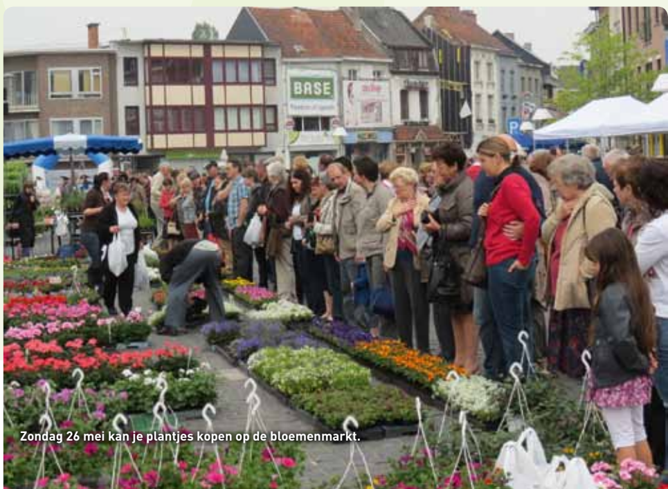
Zondag 26 mei kan je plantjes kopen op de bloemenmarkt.

Dienst leefmilieu, 054 31 32 71, leefmilieu@ninove.be .