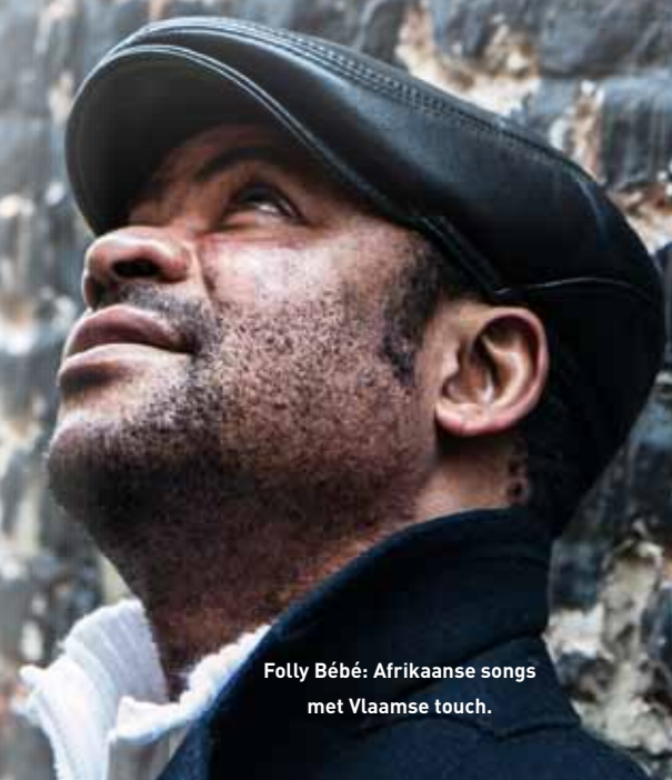
Folly Bébé: Afrikaanse songs met Vlaamse touch.