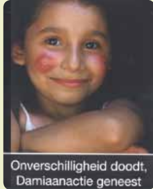
Onverschilligheid doodt, Damiaanactie geneest

Vorig jaar kon het Dr. Hemerijckxcomité met de steun van de Ninovieters 911 lepra- en tbc-lijdgers genezen. In het weekend van 25-27 januari zullen vrijwilligers opnieuw stiften of een omslag van de Damiaanactie aanbieden. Bij storting van 40 euro op BE05 0000 0000 7575 van de DAMIAANACTIE, Leopold II-laan 263, Brussel bekom je een fiscaal attest. Voor 40 euro kan je al een zieke genezen!