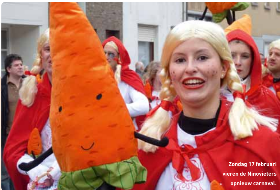
Zondag 17 februari vieren de Ninovieters opnieuw carnaval.

Heb je interesse? Dien dan ten laatste op 21 januari 2013 je schriftelijke kandidatuur in via de dienst sociale zaken, Centrumlaan 100, 9400 Ninove, 054 31 32 45.