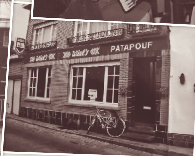
Van links naar rechts: Piranhas (Ninove), In de groten ezel (Ninove), Den hoed (Meerbeke), Patapouf (Appelterre) en Poepelau (Ninove)