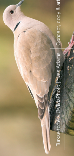
Turkse tortels. Concept, copy & art. www.jusbox.be

Let op: na publicatie van deze folder, kan de wet gewijzigd zijn. Kijk voor de meest actuele informatie op www.natuurenbos.be .