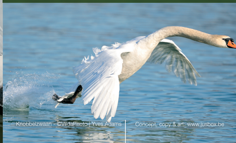
Knobbelzwaan Concept, copy & art: www.jusbox.be