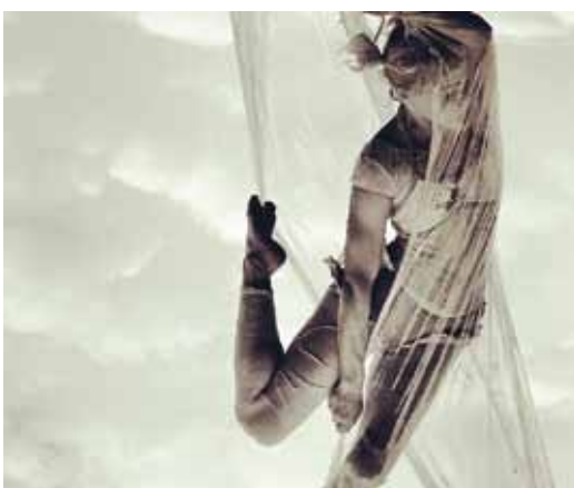
@standaert_anneleen: Life in plastic...it's fantastic! 🇩 #circuslife #act #woman #amazing #showtime #plastic #flying #strongwoman #cirque #dedonderdagen #lecirqueduplatzak #acrobate #dream #stadninove #picmyplace