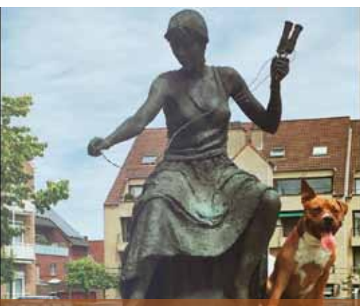
@board_ink: #ninof #stadninove #ninove #picmyplace #tbt #thor #amstaff #americanstaffordshireterrier #americanstaffordshire #notapitbull #posing #dogmodel #dog #k9 #canine #chien #thecutest #thesweetest #sweet #mybestfriend #barkyo