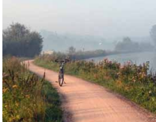
@depelseeneer: Morning bike ride along the dender #stadninove #dender #fietspad #tragele #pollare #ochtend #biketrip #bike #morning #sunrise #picmyplace #river #summer #nikonphotography #vlerickfietsen #scheldeland #flemishardennes #vlaamseardennen #oostvlaanderen