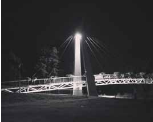
@geertsclieken: #ninove #brug #water #reflection #bridge #ninove #walking #belgium #instagram #night #blackandwhite #dender #water #bnw #bnw_captures #streetphotography #nightlife #picmyplace #monochrome