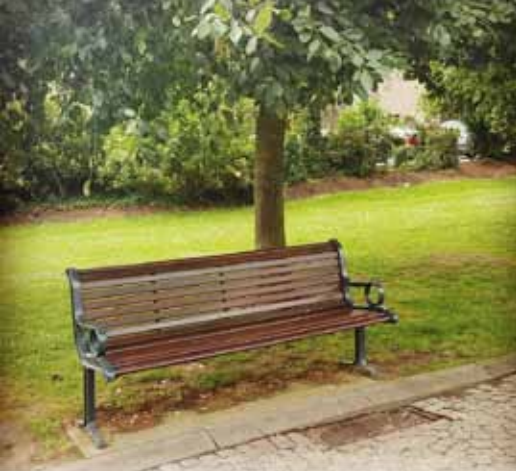
@Bechirdalhoumi: #picmyplace #ninove