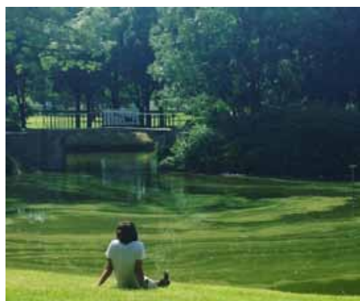
@tanjaneeck: Park van Ninove, waar de algen de grassprietten kussen #picmyplace #park #zomerdag