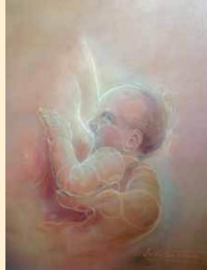
Moeder en kind