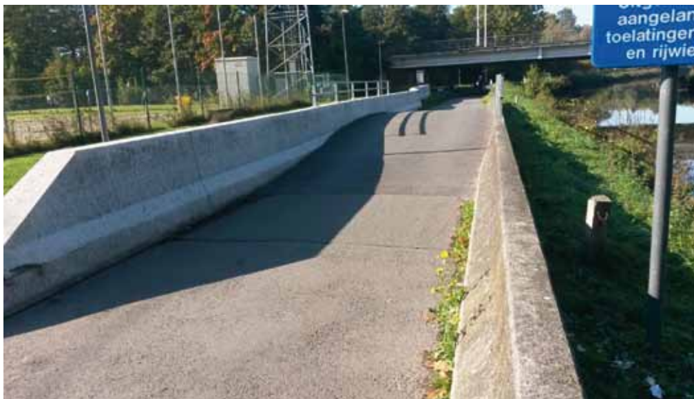
De buffer langs de Dender

Herfstmaanden zijn natte maanden. Overstromingen zoals in 2010 hopen we nooit meer te moeten meemaken. Gedurende het jaar én tijdens periodes van langdurige regen, wordt er o.a. door de stad aandacht besteed aan het vermijden van overstromingen.