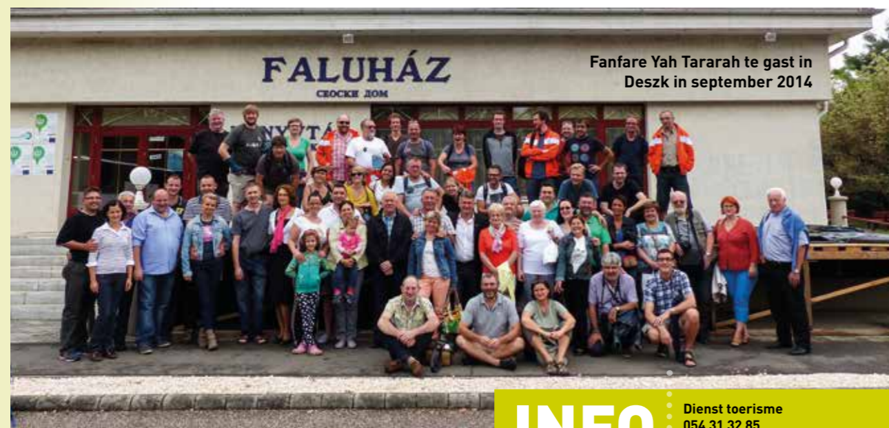
Fanfare Yah Tararah te gast in Deszk in september 2014