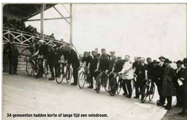
34 gemeenten hadden korte of lange tijd een velodroom.