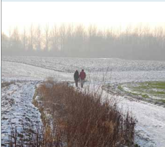
Wandel op 24 januari mee in Meerbeke.