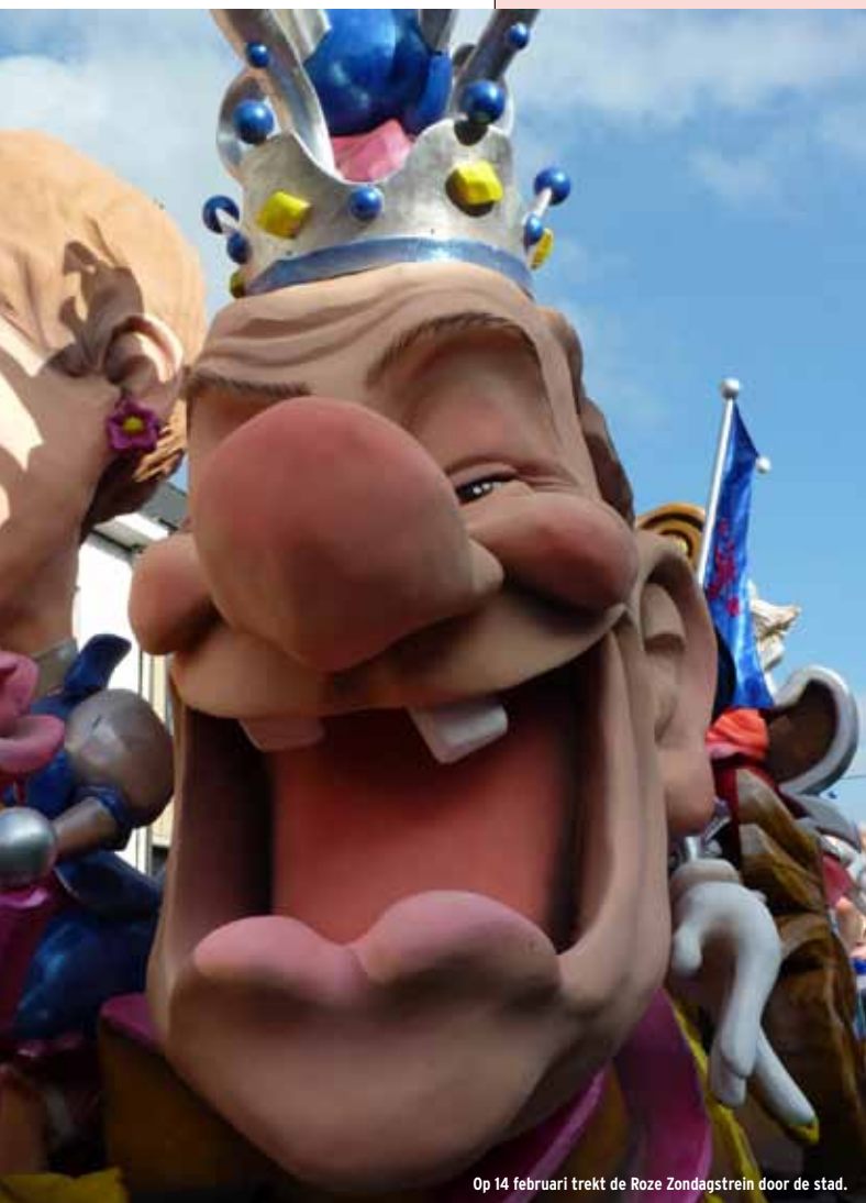
Op 14 februari trekt de Roze Zondagstrein door de stad.