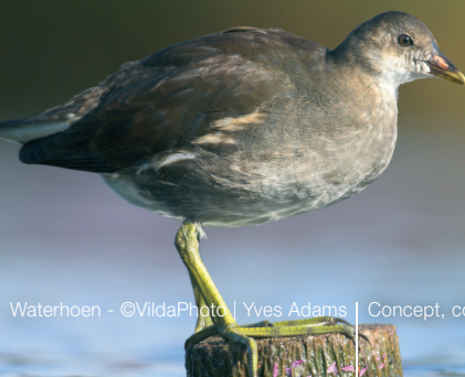
Waterhoen Concept, copy & art: www.jusbox.be

Let op: na publicatie van deze folder, kan de wet gewijzigd zijn. Kijk voor de meest actuele informatie op www.natuurenbos.be .