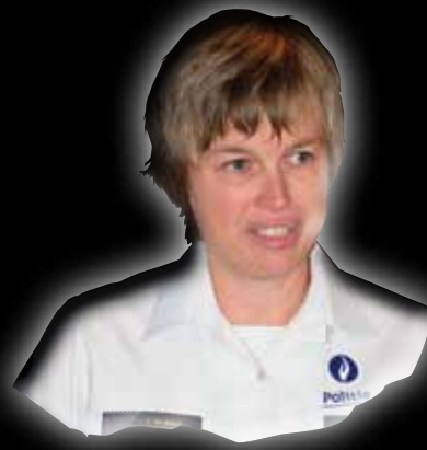
Catherine De Bolle