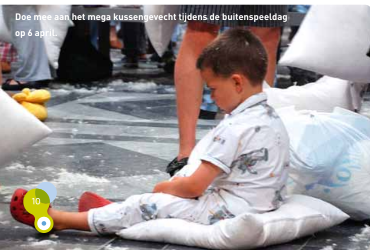
Doe mee aan het mega kussengevecht tijdens de buitenspeeldag op 6 april.