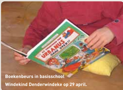
Boekenbeurs in basisschool Windekind Denderwindeke op 29 april.