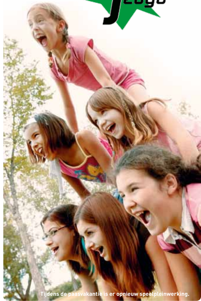
Tijdens de paasvakantie is er opnieuw speelpleinwerking.