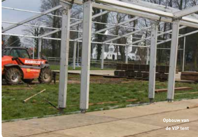
Opbouw van de VIP tent