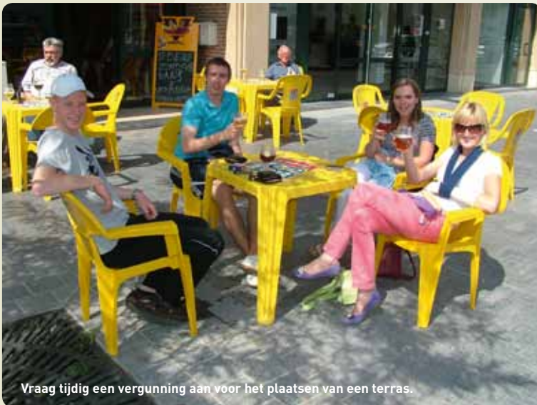
Vraag tijdig een vergunning aan voor het plaatsen van een terras.