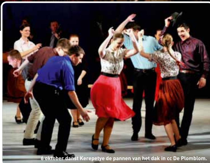
6 oktober danst Kerepetye de pannen van het dak in cc De Plomblom.

Dienst toerisme, 054 31 32 85, toerisme@ninove.be