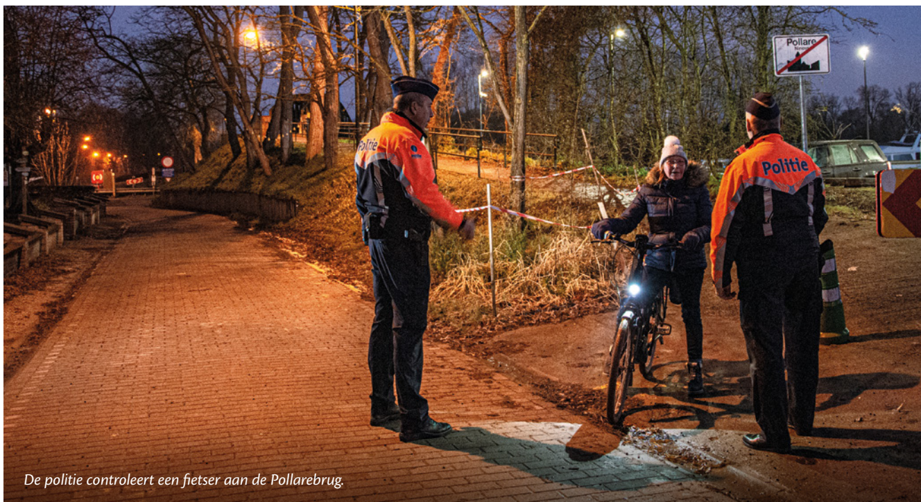
De politie controleert een fietser aan de Pollarebrug.