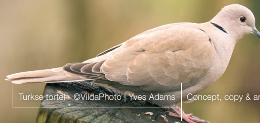
Turkse tortel - ©VildaPhoto | Yves Adams | Concept, copy & art: www.jusbox.be

Let op: na publicatie van deze folder, kan de wet gewijzigd zijn. Kijk voor de meest actuele informatie op www.natuurenbos.be .