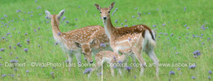
Damhert Concept, copy & art: www.jusbox.be

Let op: na publicatie van deze folder, kan de wet gewijzigd zijn. Kijk voor de meest actuele informatie op www.natuurenbos.be .